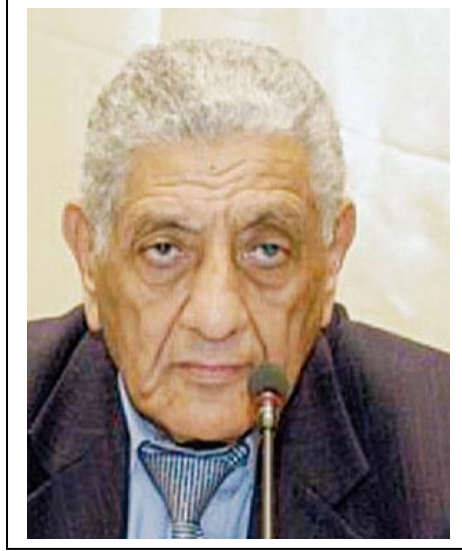
عبد التواب يوسف ١٩٢٨ - ٢٠١٥