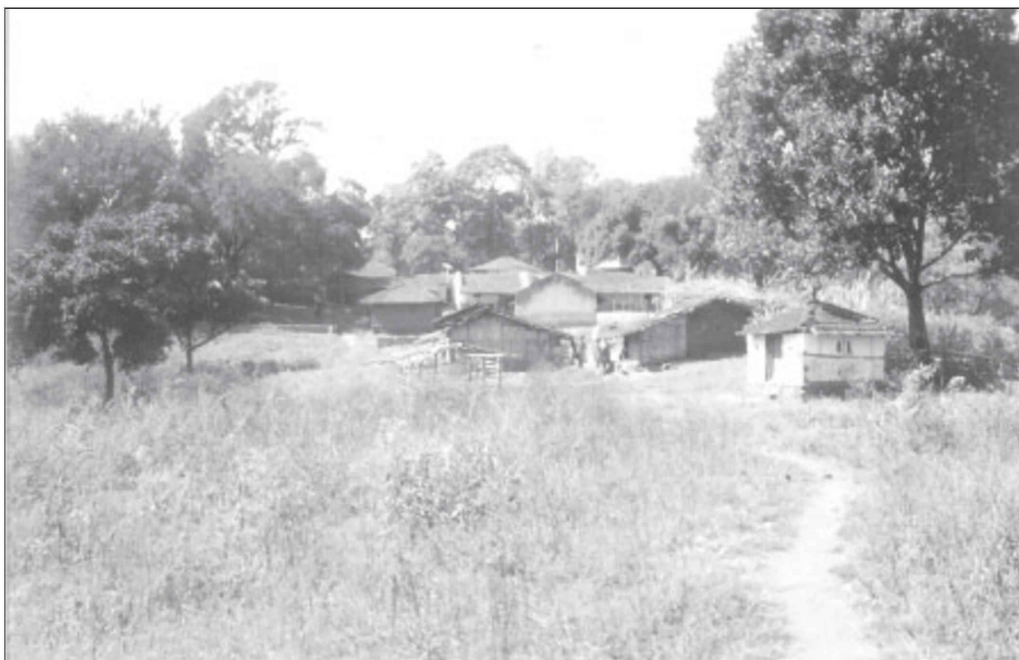
അട്ടപ്പാടിയിലെ കുറുമരുടെ പുനരധിവാസ കേന്ദ്രം