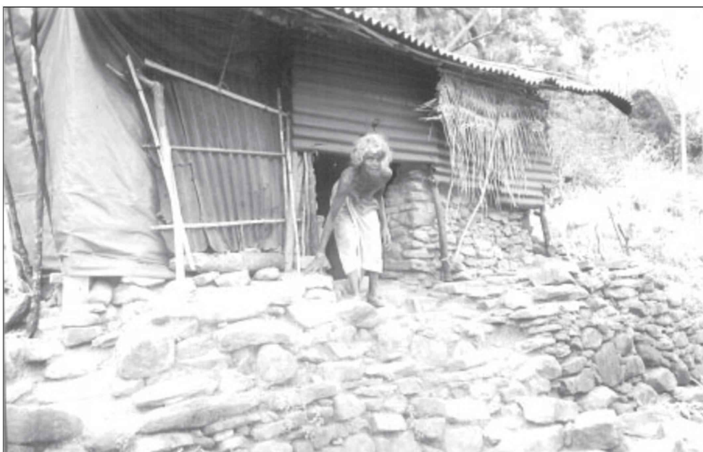
വയനാട്ടിലെ കാട്ടുനായ്ക്കരുടെ കുടിൽ