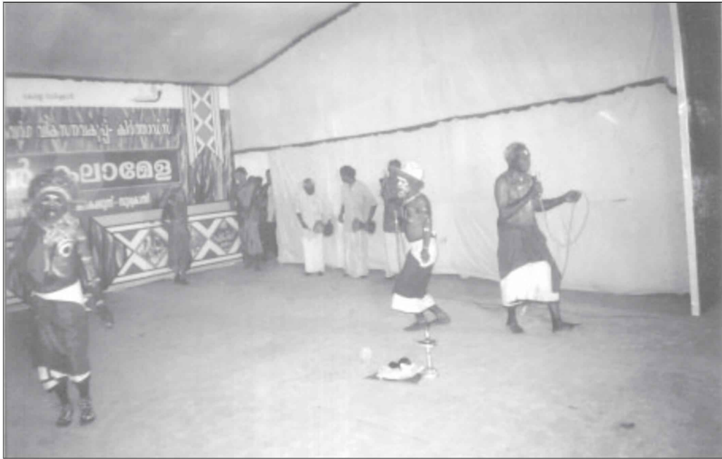
ആദിവാസികളുടെ ഗദ്ദിക സ്റ്റേജിൽ അവതരിപ്പിക്കുന്നു