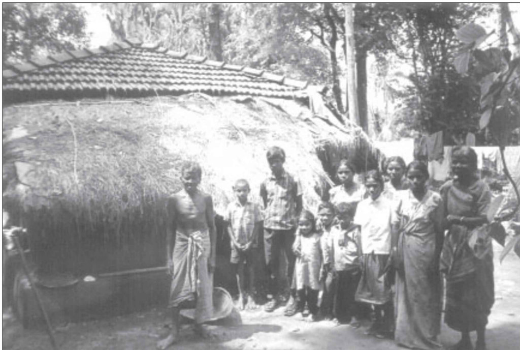
കാട്ടുനായ്ക്കരുടെ പുതിയ രീതിയിലുള്ള കുടിൽ