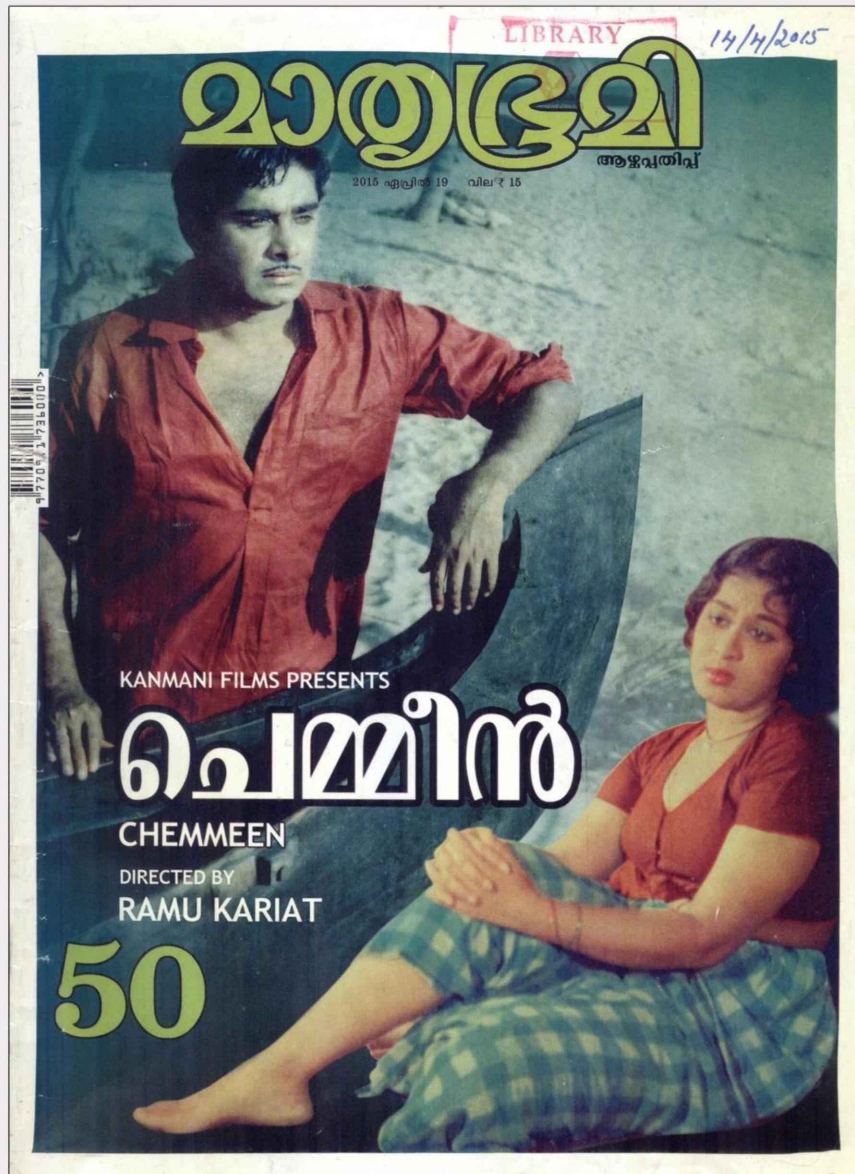
ഫോട്ടോ 6: ചെമ്മീൻ 50 മാതൃഭൂമിയിൽ (19 ഏപ്രിൽ 2015 മുഖചിത്രം)