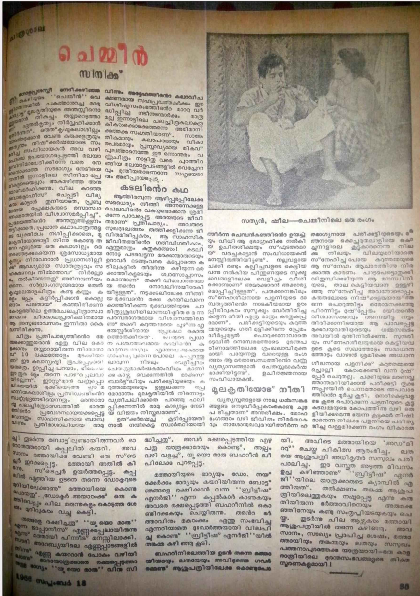
ഫോട്ടോ 5: ചെമ്മീൻ പിറവി മാതൃഭൂമിയിൽ 14 സെപ്റ്റംബർ (1966 പേജ് 35)